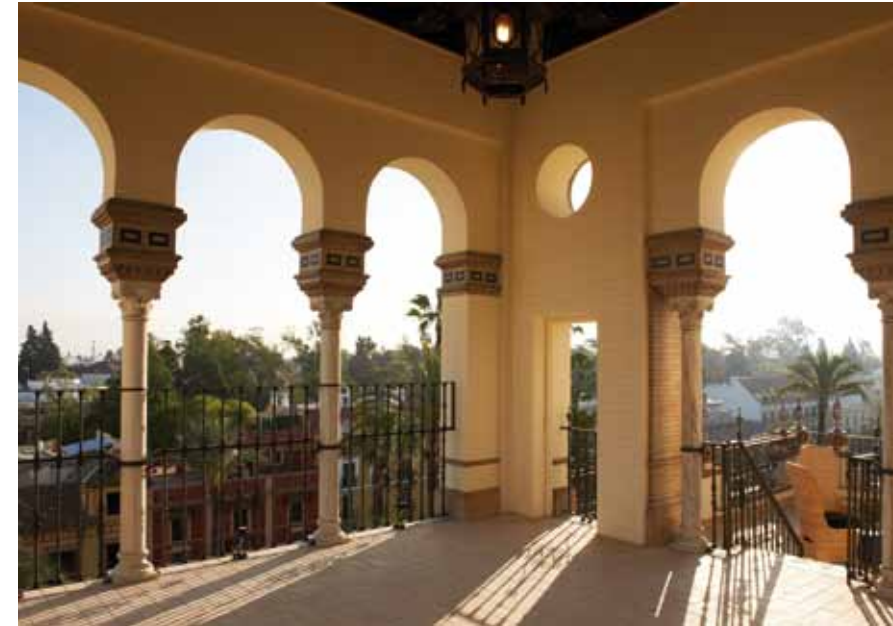
Foto: Hotel Alfonso XIII. Exterior

¿Qué mejoras se han realizado que contribuyan al confort de los huéspedes? (Domótica y nuevas tecnologías) ¿Por qué es ahora mejor el Hotel Alfonso XIII?